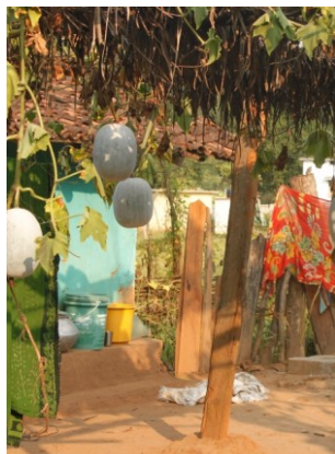
घर के सामने लौकी की तुम्बियाँ